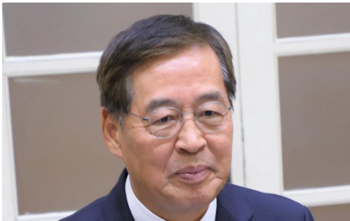
S.E. Shin Hall-Cheol Enviado Especial do Ministro dos Negócios Estrangeiros da Coreia

Angola e a Coreia mantêm boas relações de amizade e cooperação, sendo que os dois países têm realizado consultas políticas regulares.