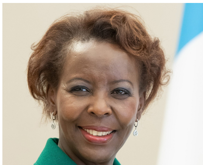
S.E Louise Mushikiwabo Secretário-Geral da Organização Internacional da Francofocia

Sua Excelência Embaixador Tété António , Ministro das Relações Exteriores da República de Angola, manteve no dia 19 de setembro , em Nova Iorque, um encontro de trabalho com Sua Excelência Louise Mushikiwabo , Secretária-Geral da Organização Internacional da Francophonie (OIF).