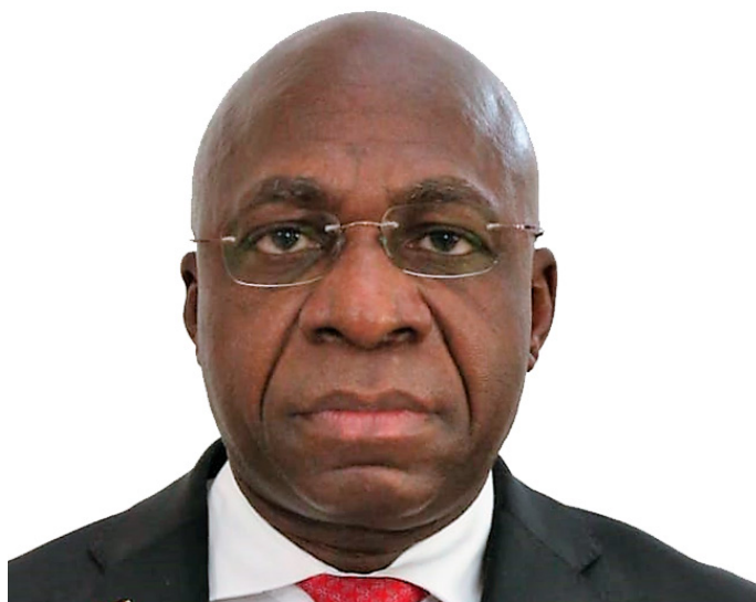
S.E Tété António Ministro das Relações Exteriores