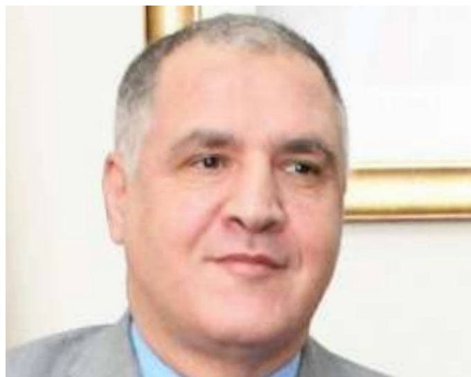
S.E. Abdelhakim Mihoubi Embaixador da Argélia em Angola

Foi destacada a importância do diálogo político e de cooperação mútua como elementos fundamentais para promover os interesses comuns e impulsionar o desenvolvimento socioeconómico de ambas as nações.