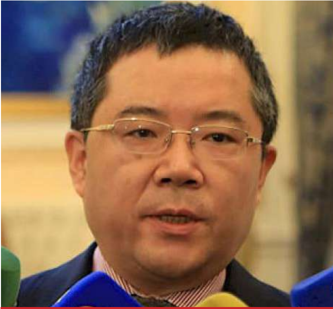
S.E. Gong Tao Embaixador da República Popular da China em Angola

Sua Excelência Téte António , Ministro das Relações Exteriores, recebeu , no dia 19 de Junho, em Luanda, Sua Excelência Gong Tao , Embaixador da República Popular da China em Angola.