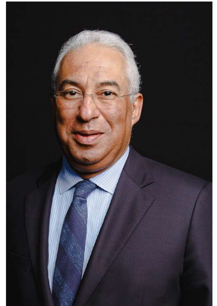
S.E. António Luís Santos da Costa Primeiro-Ministro da República Portuguesa