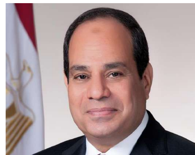
S.E. Abdel Fattah el-Sisi Presidente da República Árabe do Egito