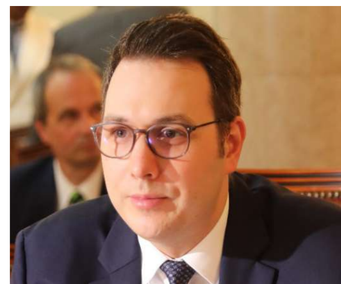
S.E. Jan Lipavsky Ministro dos Negócios Estrangeiros da República Checa

Para o Ministro Tété António , o Governo angolano tem traçado várias reformas estruturais para a melhoria do ambiente de negócios, tendentes a incentivar a atração e captação de investimento estrangeiro directo, com benefícios fiscais especiais nas principais zonas e regiões do país, tendo em conta a diversificação da economia.