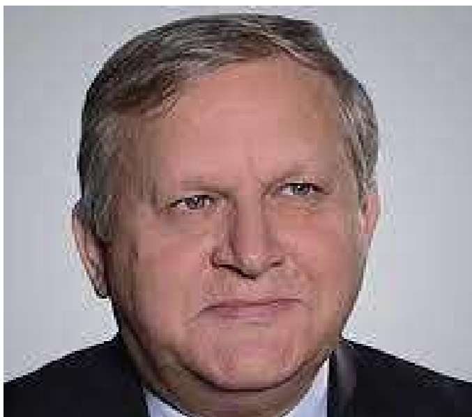
S.E. Vladimir Tararov Embaixador da Federação Russa em Angola

O encontro serviu para as duas entidades falarem da dinamização das consultas políticas entre Angola e a Rússia, bem como da necessidade da realização da Comissão Intergovernamental para a Cooperação Económica entre os dois países.