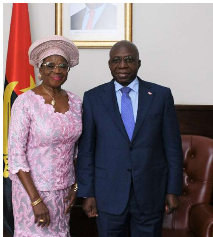
Momento de Despedida de Sua Excelência Secretária Executiva da Comissão do Golfo da Guiné

Desempenhou igualmente as funções de Alta Comissária do seu país no Haiti e na República Dominicana, além de Chefe do Protocolo do Ministério dos Negócios Estrangeiros da Nigéria.