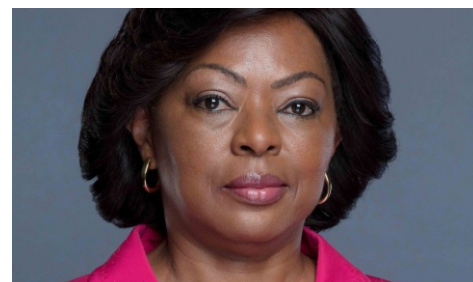
Primeira-Dama quer mais mulheres na gestão de topo das instituições