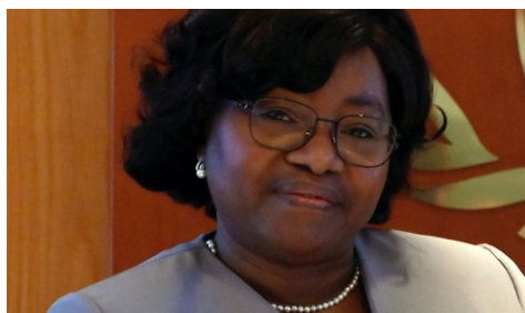
Embaixadora Isabel Godinho termina missão como Cônsul-Geral no Porto

É a nova Embaixadora Extraordinária Plenipotenciária de Angola em Portugal